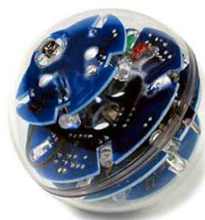
شکل ۱- نمونه شکل داده شده

نمودار در زیر آمده است: (توجه شود که شکل‌ها و نمودارها نیز، همانند جدول‌ها باید در موقعیت وسط‌چین نسبت به طرفین کاغذ و در جداولی با خطوط بی‌رنگ مطابق زیر قرار گیرند.)